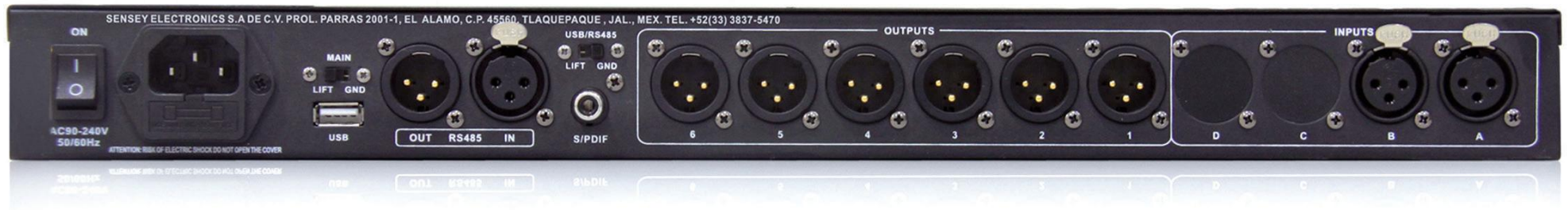
• vista posterior